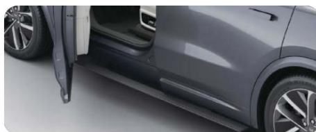
Выдвижные пороги с электроприводом 2