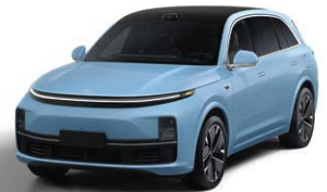
Голубой перламутровый - Особая серия 1