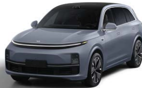
Серо-голубой - Особая серия 1