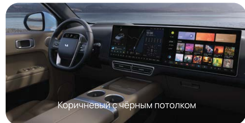
Коричневый с чёрным потолком