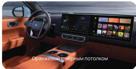
Оранжевый с чёрным потолком