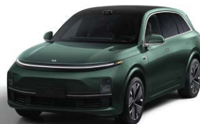
Глубокий зелёный перламутровый - Особая серия 1