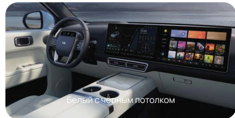
Белый с чёрным потолком